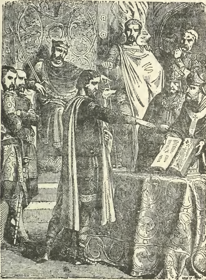
Harold prêtant serment sur un reliquaire.

opinion, indubitable en apparence, des racines dans une version étrangement fautive de l'histoire des quinze dernières années. On faisait de la fuite de l'archevêque Robert et de son retour honteux en Normandie, une première ambassade envoyée par Edward à Guillaume, pour lui annoncer que les grands d'Angleterre consentaient à ce qu'il fût héritier de la couronne, et, pour comble d'ab-